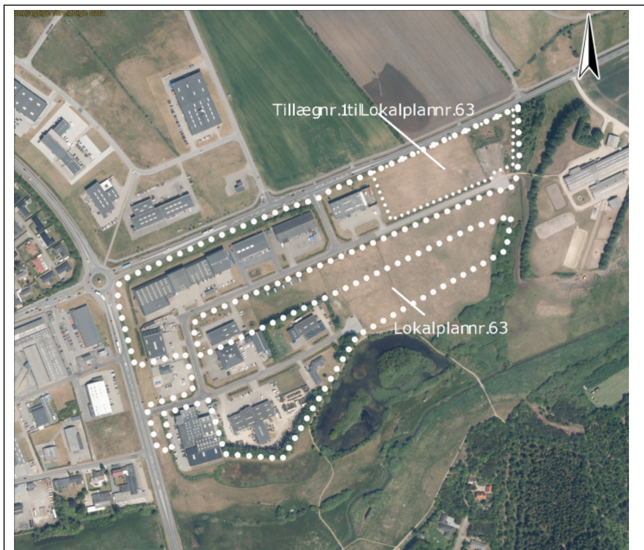
Lokalplantillæggets afgrænsning vist med en lille priksignatur.

For et område til erhvervsformål ved Jægervej i Skjern