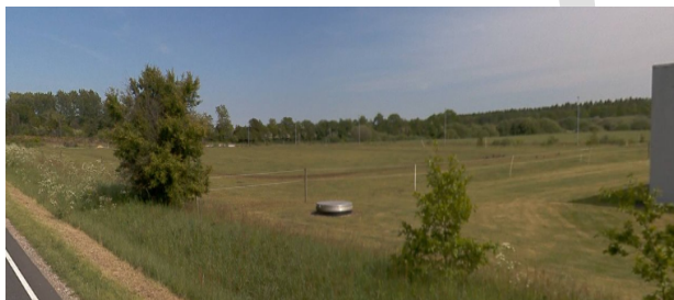
Her ses udlægget af lokalplantillæggets nye delområde III fra Arnborgvej i vestgående retning.

Lokalplantillægget udlægger et nyt delområde III som vist på kortbilag T3. Området anvendes til erhvervsformål i form af salgsvirksomheder med udstillingsbehov og detailsalg, der ikke forhandler dagligvarer, servicestation og kontorvirksomhed, samt mulighed for en restaurant/drive in.